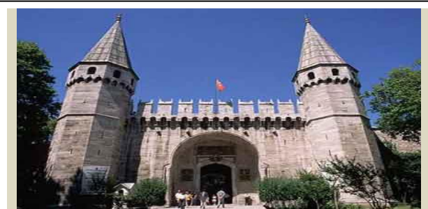
XIX.yüzyılda Merkez Teşkilatında Değişmeler 2