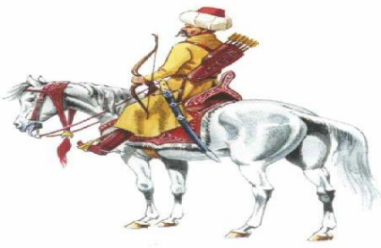
Tımarlı Sipahiler 3