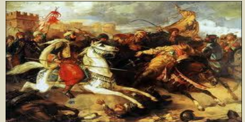
Kapıkulu Sipahileri (Altı Bölük Halkı) 4