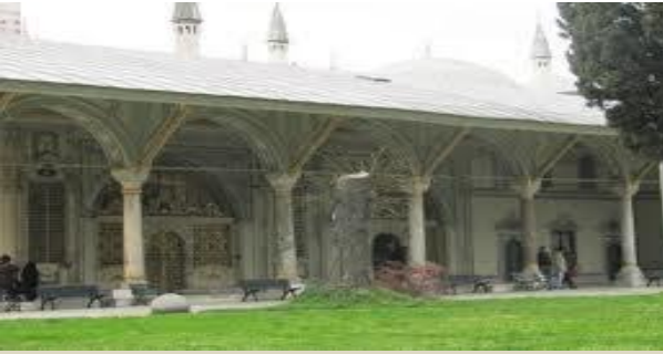
Divan-1 Hümayun 3