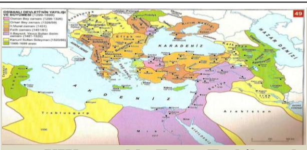
XIX.yüzyılda Taşra Teşkilatında Değişmeler 4