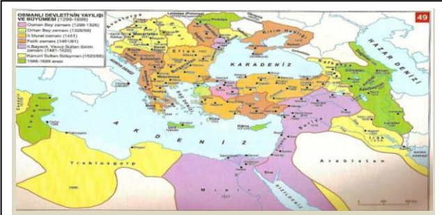
XVIII.yüzyılda Taşra Teşkilatında Değişmeler 1