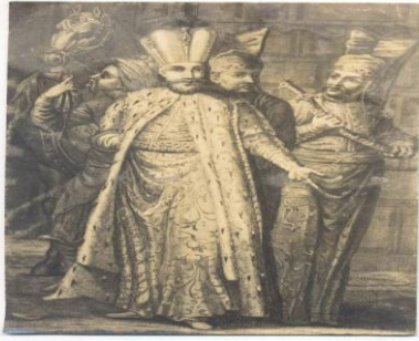
Kapıkulu Ocakları 1