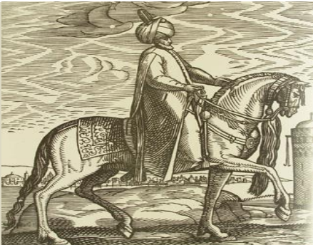
Müsellim (Mütesellim) 3