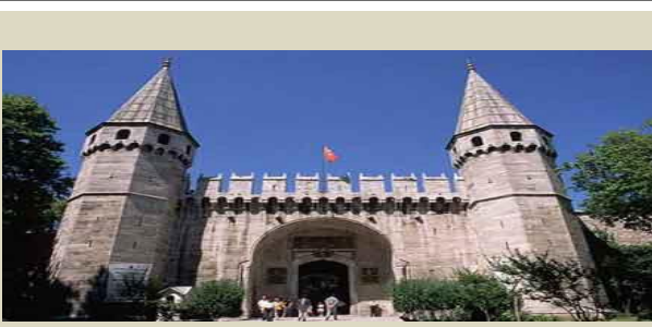
XIX.yüzyılda Merkez Teşkilatında Değişmeler 3