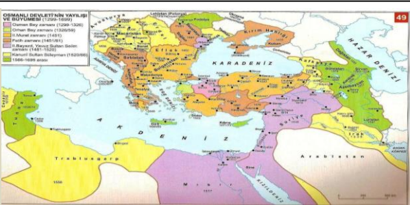
XIX.yüzyılda Taşra Teşkilatında Değişmeler 1