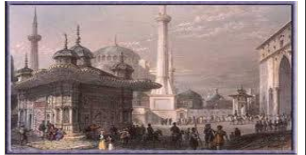
İstanbul'un Yönetimi 4