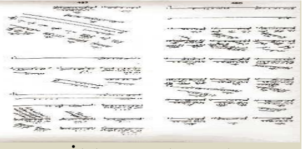
İltizam Sistemi 2