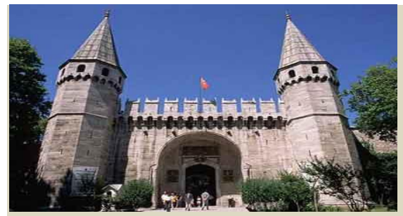
XVIII.yüzyılda Merkez Teşkilatında Değişmeler 2