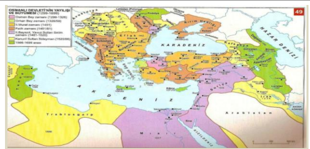
XVIII.yüzyılda Taşra Teşkilatında Değişmeler 4