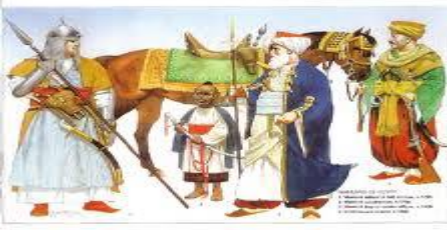
Tımar Sistemi 3