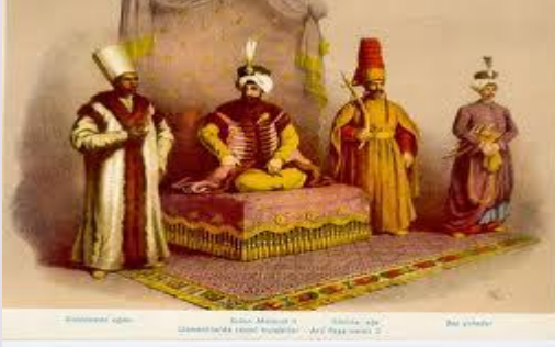
Dikey Hareketlilik 3