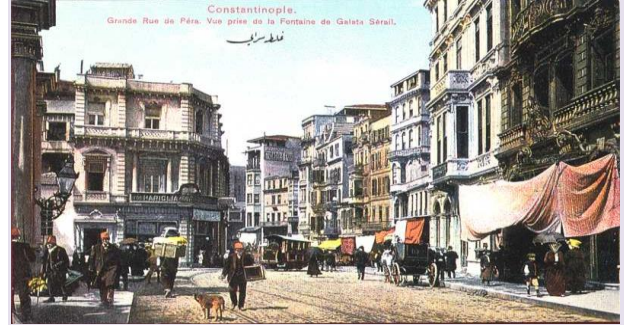
Yatay Hareketlilik 4