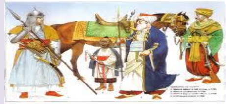
Devletin Resmi Tasnifine Göre Osmanlı Toplumunu 2