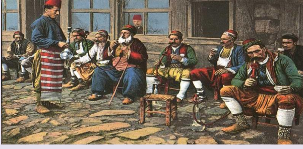
Yerleşim Durumlarına Göre Osmanlı Toplumunu 1