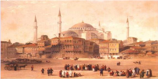
Osmanlı Toplum Yapısının Değişmesinin Sebepleri 1